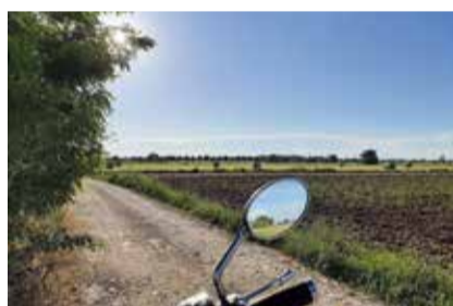
CAMPAGNA REGGIANA RESPIRANDO L'ESTATE