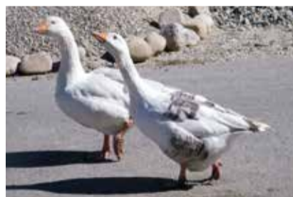
ROMANIA: TRANSILVANIA OCHE A SPASSO