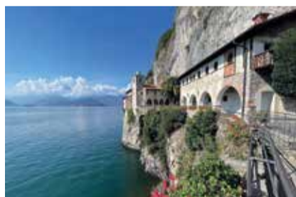
LAGO MAGGIORE: EREMO SANTA CATERINA DEL SASSO VIE DELL'ACQUA E DELLO SPIRITO