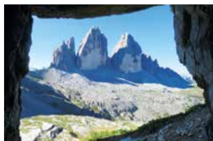
ALTO ADIGE: DOLOMITI LE TRE CIME IN CORNICE