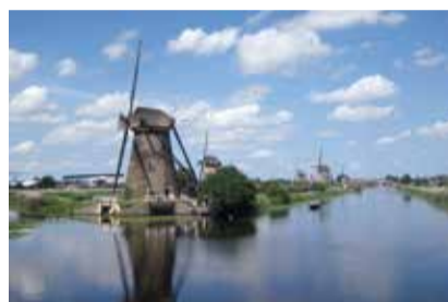
OLANDA: KINDERDIJK MULINI DA FIABA