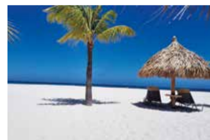
CARAIBI: ISOLA DI ARUBA WELCOME TO PARADISE