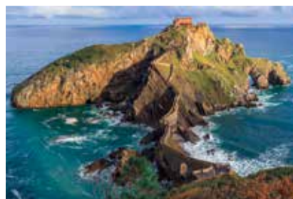
SPAGNA: EREMO SAN JUAN GAZTELUGATXE MEDITAZIONI ESTREME