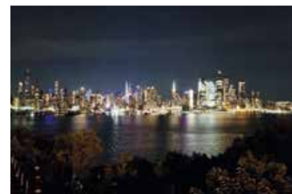
U.S.A.: NOTTE MAGICA A NEW YORK CITY