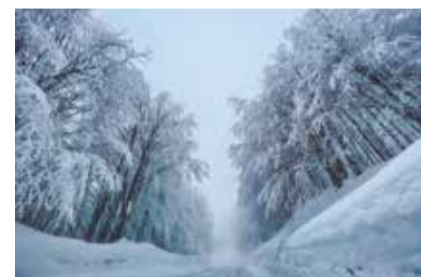
APPENNINO TOSCO-EMILIANO: PASSO DI PRADARENA SUGGERIONE NEL BOSCO INCANTATO