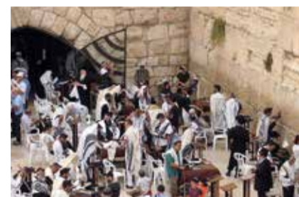
ISRAELE: GERUSALEMME MURO DEL PIANTO...DUEMILA ANNI OR SONO