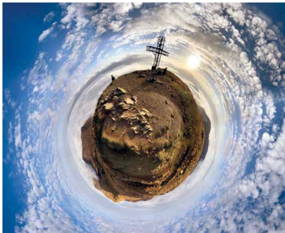
APPENNINO REGGIANO VENTASSO NEL COSMO