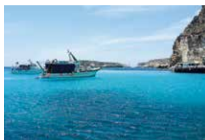
LAMPEDUSA MARE D'AMARE