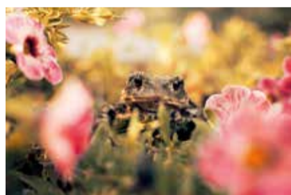
APPENNINO REGGIANO GIARDINO CON OSPITE