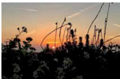
Tramonto a Sant'Ilario d'Enza CATTABIANI MAURIZIO