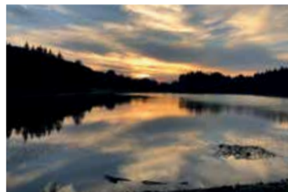
Tramonto sul Ventasso LAGO CALAMONE FABBIANI PAOLO