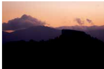
Tramonto a Castelnovo ne' Monti PIETRA DI BISMANTOVA GENTILI ANDREA