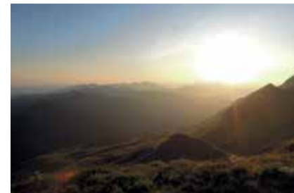
Tramonto da Febbio 2000 VISTA MONTE CUSNA GIGANTE SAMANTA