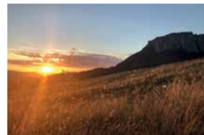
Tramonto a Ginepreto di Castelnovo ne' Monti - VISTA PAESE DALLA PIETRA DI BISMANTOVA FABBIANI PAOLO