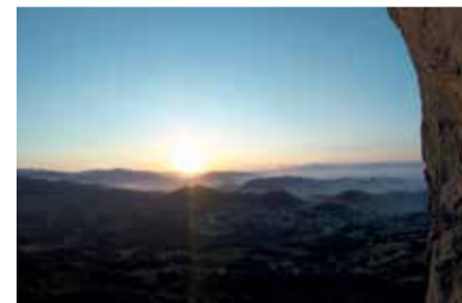
Tramonto a Castelnovo ne' Monti VISTA PAESE DA PIETRA DI BISMANTOVA FABBIANI PAOLO