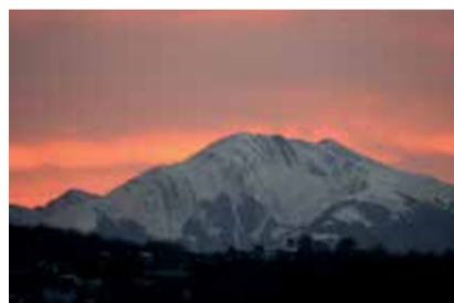
Tramonto a Sologno VISTA MONTE VENTASSO MARIANI ROBERTO