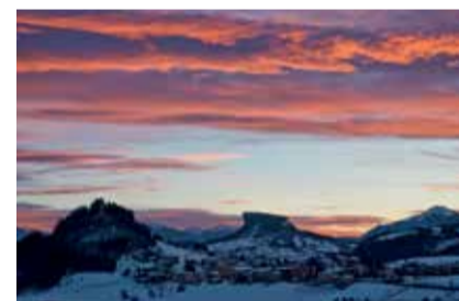
Tramonto a Felina - VISTA PAESE E PIETRA DI BISMANTOVA GAMBARELLI ALESSANDRO