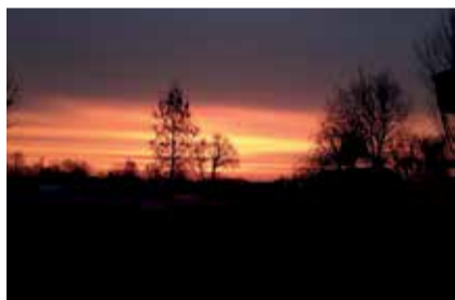
Tramonto a Praticello di Gattatico SENATORE SALVATORE