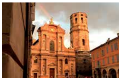
Tramonto a Reggio Emilia PIAZZA SAN PROSPERO GALLI PETRA