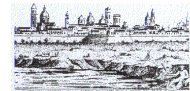
Associazione dei Geometri della Provincia di Reggio Emilia